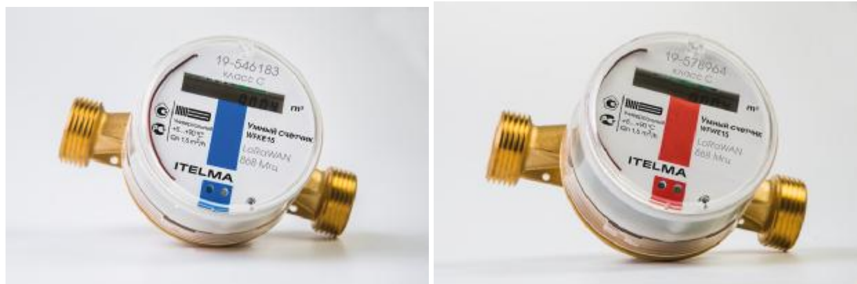
Рисунок 1 - Общий вид счетчиков воды электронных WFKE, WFWE

Защита от несанкционированного доступа счетчиков воды электронных WFKE, WFWE обеспечивается неразборной конструкцией счетного преобразователя, в которой прозрачная крышка счетного механизма запрессовывается на корпус измерительной камеры и не может быть снята без разрушения.