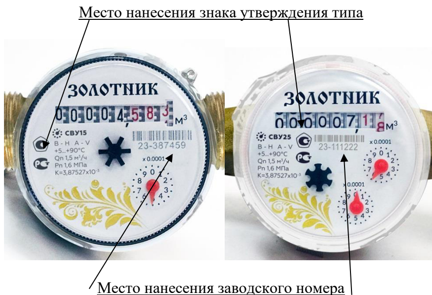
Рисунок 3 – Место нанесения знака утверждения типа и заводского номера