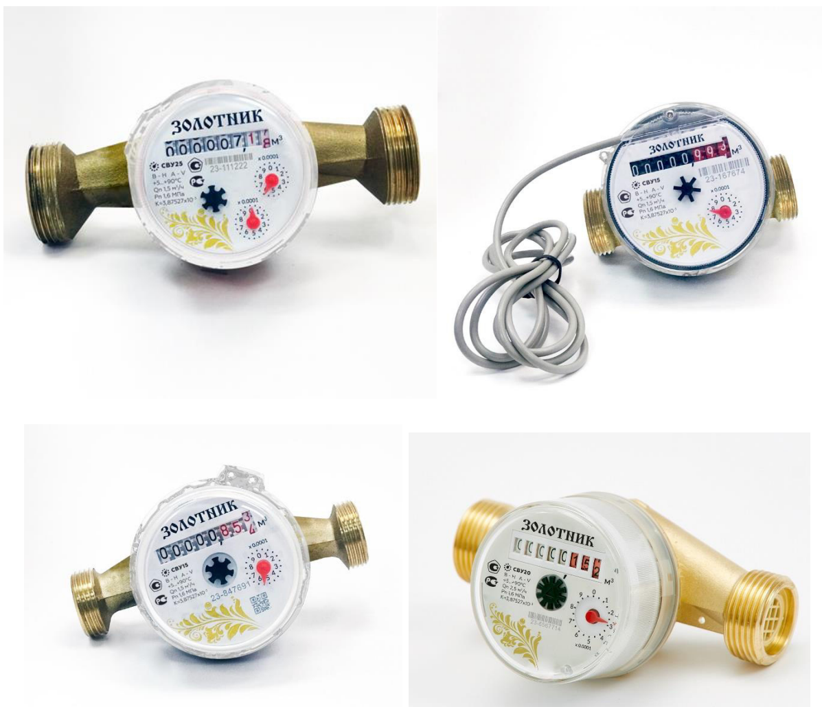
Рисунок 1 – Общий вид, счётчики воды универсальные СВУ15, СВУ20, СВУ25